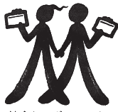
協会シンボルマーク